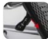
Palanca de reclinación Syncro y Profundidad.