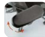
Brazos Regulables Altura y ángulo 3D.