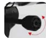
Perilla de tensión de inclinación del respaldo.