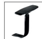
B/Reg.BRC 22 PP