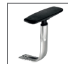
B/Reg BRC 19 CR